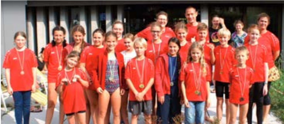
Team 6. Inklusionsschwimmfest Nellingen.