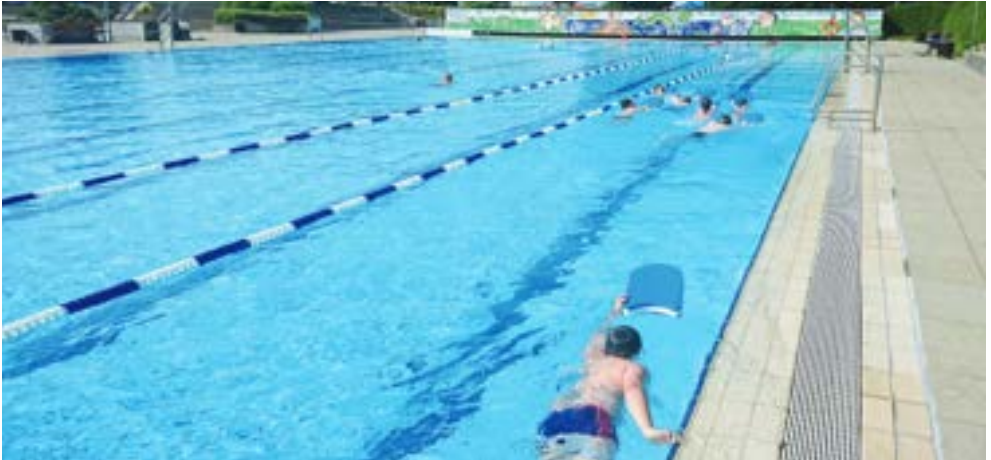
Training im Enztalbad Freibad