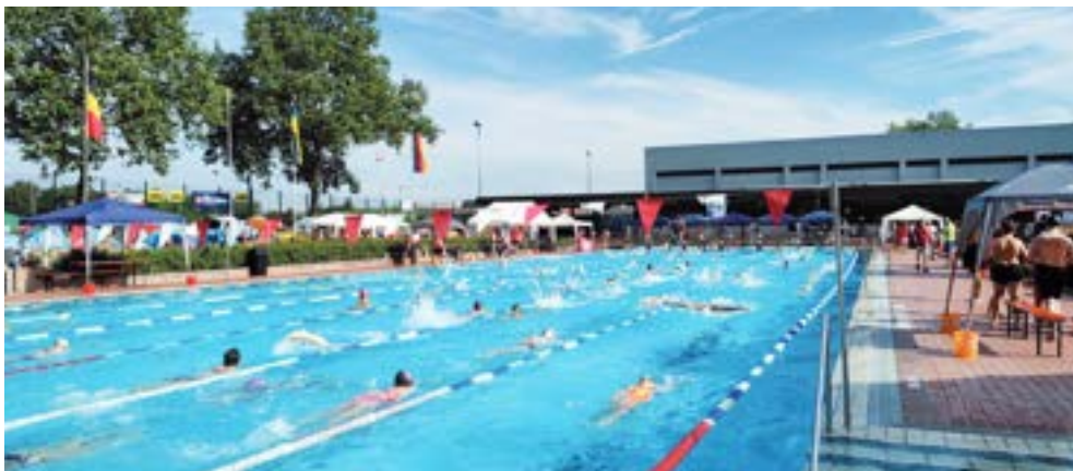
29. Internationales Bühler Schwimm-Meeting.