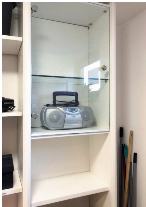
gespendete Vitrine für unseren Vorratsraum