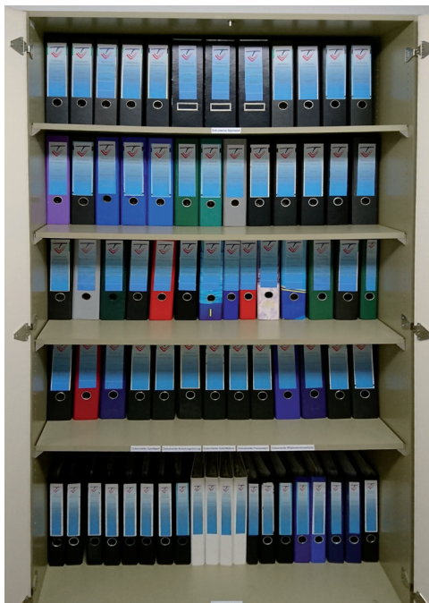
Sortierung des Büros der Abteilungsleitung

Schwimmabteilung Florian Lechermann und Tim Bauer, die sich über das Jahr hinweg durch viele Verordnungen und Hygienekonzepte durchbeißen mussten, um auf Grundlage dessen den Vereinsbetrieb inklusive der Schwimmkurse und der Schwimmtrainings planen und organisierten. Nur durch die gute Zusammenarbeit aller Beteiligten konnte das Schwimmjahr 2020 in dieser Form gelungen umgesetzt werden. Vielen Dank!