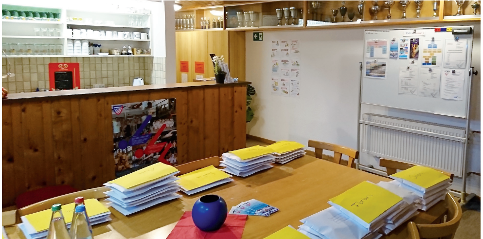
Sortieren und Eintüten der neuen Flyer