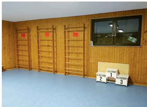
Sporthalle in unserem Vereinsheim

Um auch weiterhin für die Sicherheit unserer Schwimmer zu sorgen, durchlaufen unsere Kursleiter und Trainer im Drei-Jahres-Rhythmus die Ausbildung zum DLRG Rettungsschwimmer Silber und besuchen einen Erste-Hilfe-Kurs beim DRK. Die Auffrischungsausbildungen und Prüfungen zum internationalen Lebensretter haben unsere Kursleiter und Trainer in diesem Jahr wieder bei der DLRG OG Bietigheim-Bissingen absolviert. Wir freuen uns sehr, dass unsere Kursleiter und Trainer diese Ausbildungen ernst nehmen und die Kurse mit Bravour meistern. Darüber hinaus müssen alle Nutzer des Enztalbades jedes Jahr an einer Sicherheitsunterweisung teilnehmen, bei welcher unter anderem technische Gegebenheiten, die Standorte der Feuerlöscher, des