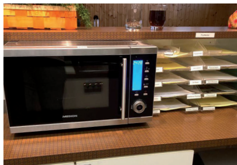
Mikrowelle von der REWE Aktion "Scheine für Vereine"